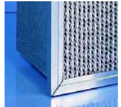
Detalle frontal del filtro

Cuando el tamaño del alojamiento de filtros debe ser lo más reducido posible o en aplicaciones donde el