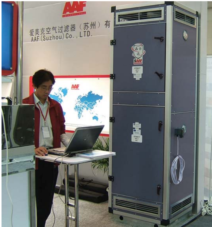
Unidad de recirculación en la exposición de Suzhou, R.P. China.