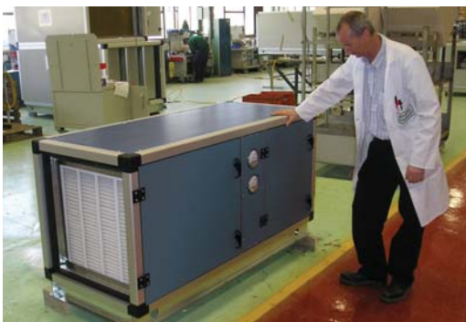
Inspección del Dept. de Calidad en la planta de Cramlington, G.B.