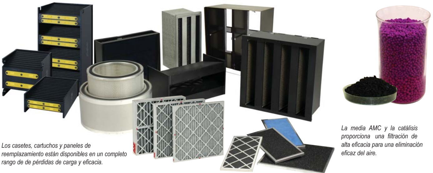
Los casetes, cartuchos y paneles de reemplazamiento están disponibles en un completo rango de de pérdidas de carga y eficacia.

Los Equipos de Filtración de Gases con Acceso Lateral están disponibles en múltiples configuraciones con tecnología AAF patentada, así como todos los formatos de presentación de media química.