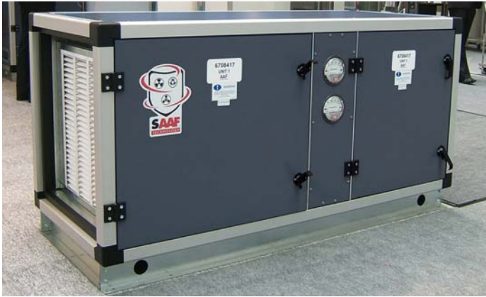
Sistema expuesto en la feria de Equipos de Acondicionamiento en Suzhou, R.P. China