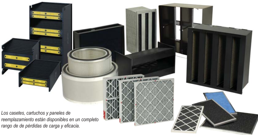
Los casetes, cartuchos y paneles de reemplazamiento están disponibles en un completo rango de de pérdidas de carga y eficacia.

Los Equipos de Filtración de Gases con Acceso Lateral están disponibles en múltiples configuraciones con tecnología AAF patentada, así como todos los formatos de presentación de media química.