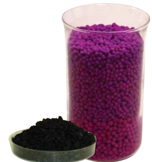
La media AMC y la catálisis proporciona una filtración de alta eficacia para una eliminación eficaz del aire.