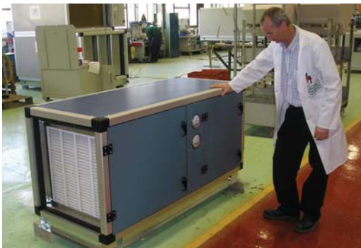
Inspección del Dept. de Calidad en la planta de Cramlington, G.B.